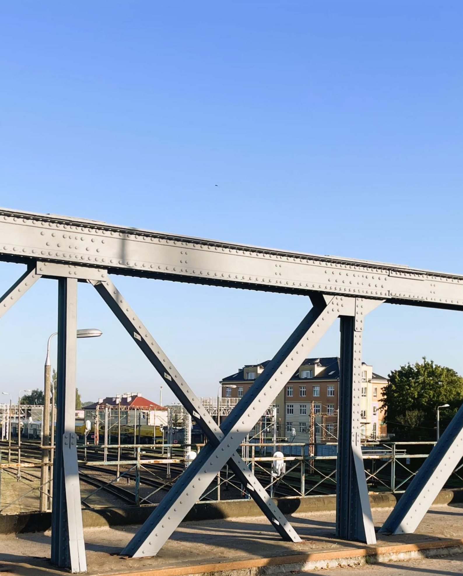
Renowacja 120-letniego zabytkowego mostu za pomocą powłoki ochronnej crebonit